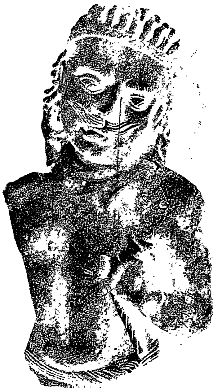
विट की मृण्मूर्ति (पटना के निकट कुम्हार से प्राप्त) डा० अल्टेकर